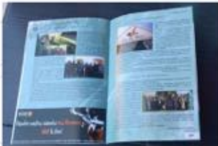
Revista Feria de Camas