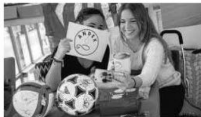
Andex participa con un 'stand'.

Los compradores podrán adquirir viviendas con descuentos desde el 10% hasta el 25%, acceder a exclusivas promociones de obra nueva, y otros servicios rela-