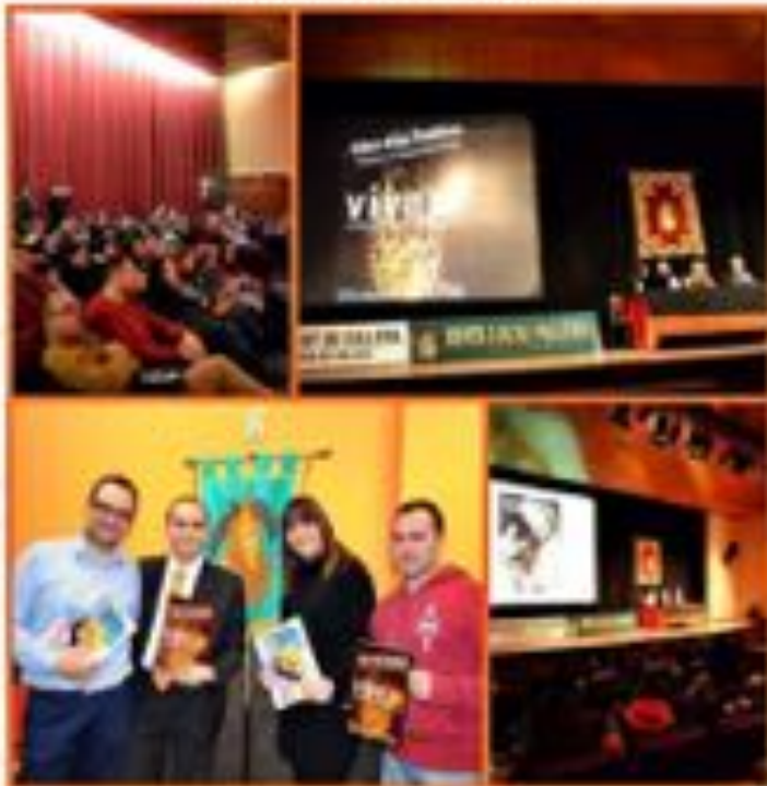
Revista Junta Local Fallera de Cullera