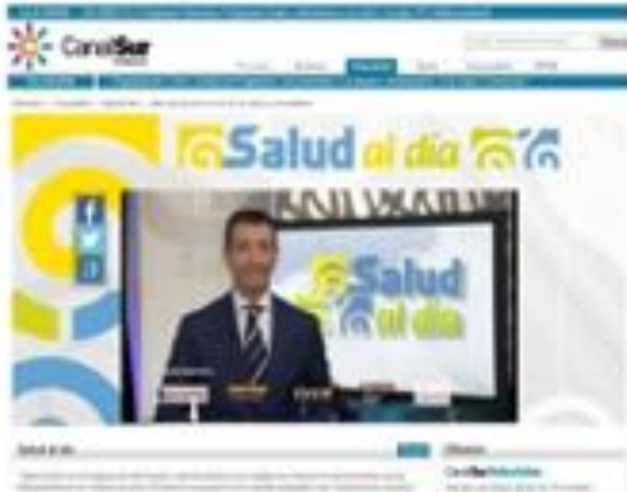
Salud al Día Canal Sur