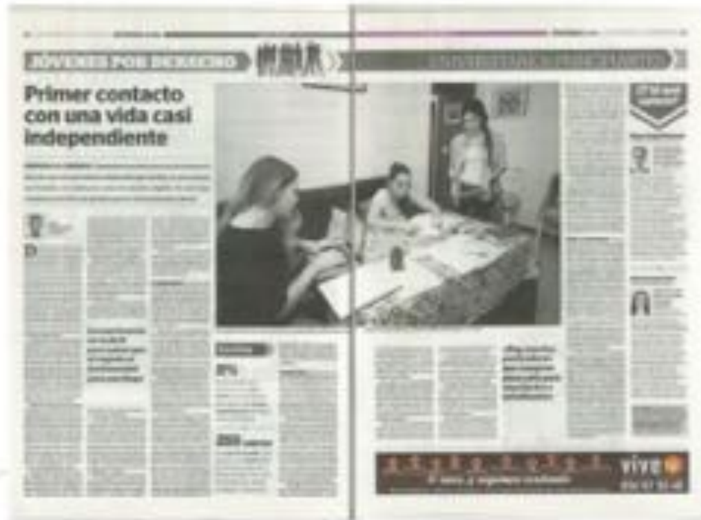
El Correo de Andalucía