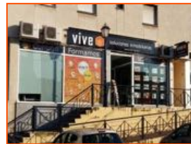
Mairena del Aljarafe