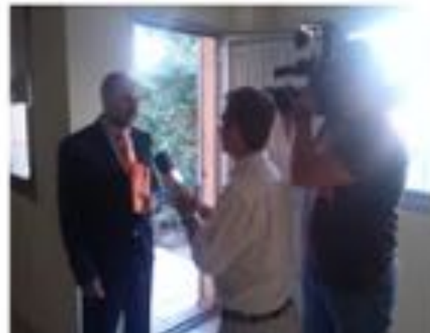
Informativos Tele 5