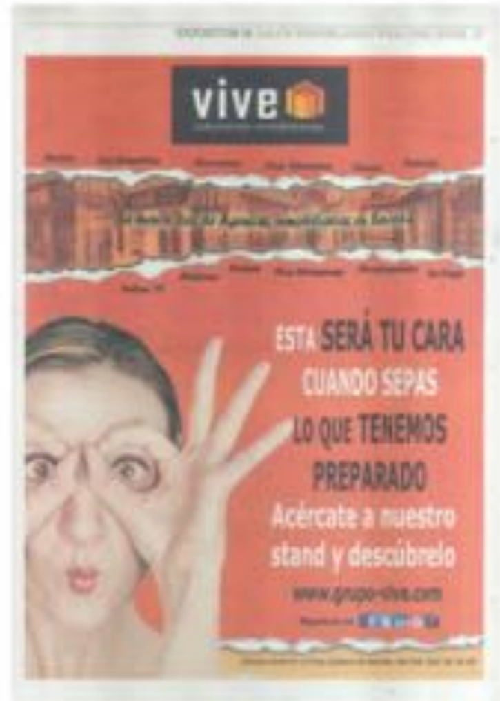
ABC de Sevilla