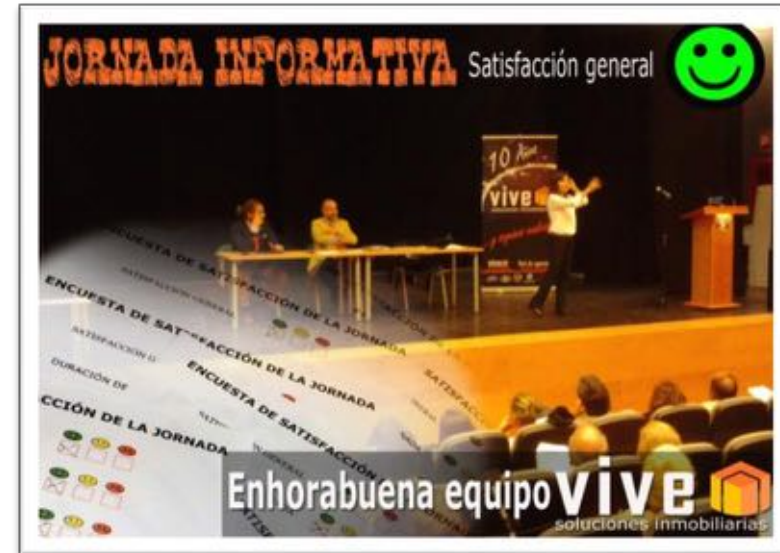
Jornada Informativa Reforma Fiscal