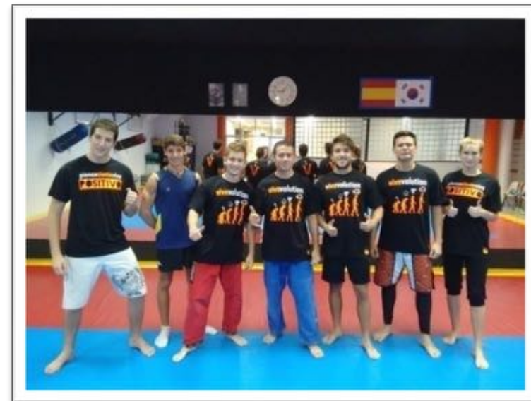
Patrocinio Deportivo Club Noss Luta

caudación que se obtenga se destinará cada año a colaborar con una buena causa. En esta ocasión, parte del tejido empresarial sevillano se ha unido para colaborar con la Asociación de Padres de Niños con Cáncer de Andalucía (Andex), que dispondrá también de un stand para recaudar beneficios para los más pequeños con merchandising donado por las empresas colaboradoras.