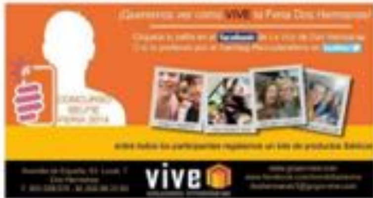
La Voz de Dos Hermanas