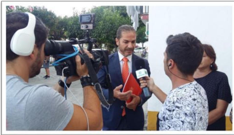
Andalucía Directo Canal Sur